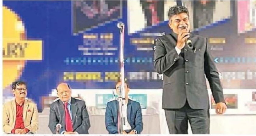
अनुबंध वृद्धाश्रम की 20 वीं वर्षगांठ की पूर्व संख्या पर आयोजित कार्यक्रम में मंचासीन कवि।